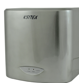
M-2008 JET (хром)

Мощность: 2750 Вт Напряжение сети: 220 В Скорость потока: 26 м/с Производительность: 450 м 3 /ч Время сушки: 10-15 сек Радиус действия сенсора: 5-20 см Класс защиты: IPX1 Материал: Нержавеющая сталь Уровень шума: 65 Дб Вес: 4,3 кг Размер В*Ш*Г: 321мм*274мм*164мм