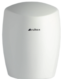
M-1250B JET (белая)

Мощность: 1500 Вт Напряжение сети: 220 В Скорость потока: 15 м/с Производительность: 85 м 3 /ч Время сушки: 30-35 сек Радиус действия сенсора: 5-15 см Класс защиты: IPX1 Материал: Пластик Уровень шума: 60 Дб Вес: 2,2 кг Размер В*Ш*Г: 240мм*205мм*255мм