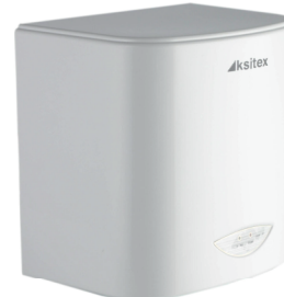
M-2008 JET (белая)

Мощность: 2750 Вт Напряжение сети: 220 В Скорость потока: 26 м/с Производительность: 450 м 3 /ч Время сушки: 10-15 сек Радиус действия сенсора: 5-20 см Класс защиты: IPX1 Материал: Нержавеющая сталь Уровень шума: 65 Дб Вес: 4,3 кг Размер В*Ш*Г: 321мм*274мм*164мм