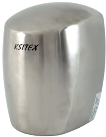
M-1250ACN JET (глянцевая)