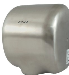
M-1800AC JET (матовая)

Мощность: 1800 Вт Напряжение сети: 220 В Скорость потока: 15 м/с Производительность: 90 м 3 /ч Время сушки: 30-40 сек Радиус действия сенсора: 5-15 см Класс защиты: IPX1 Материал: Пластик Уровень шума: 70 Дб Вес: 2,25 кг Размер В*Ш*Г: 250мм*238мм*230мм